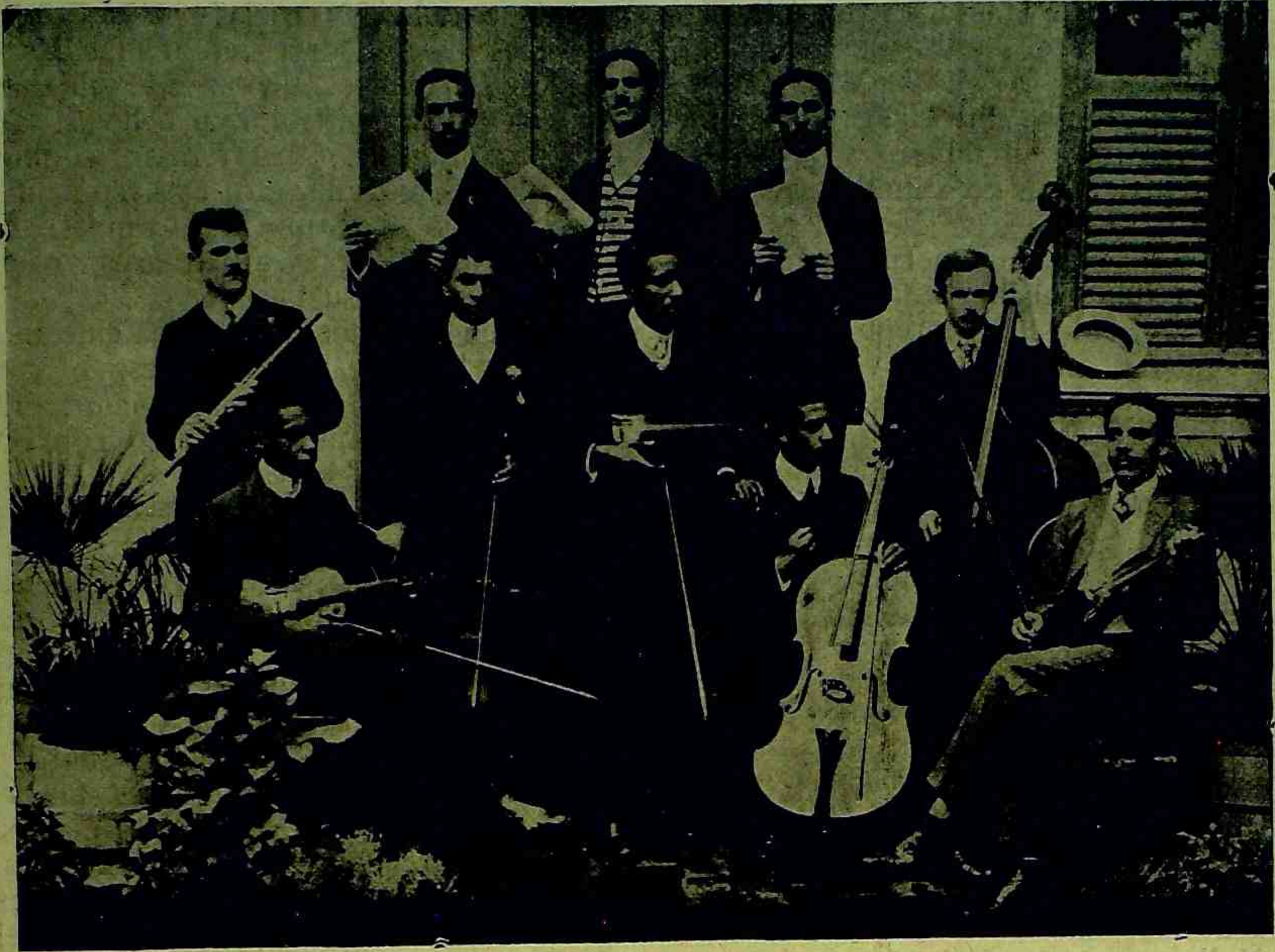
Musicos que se offereceram a tocar na festa da primeira communhão do Cathecismo.

Mengato, que todos no firme proposito de vencer na luta, proseguirão na marcha que os conduz á eternidade.