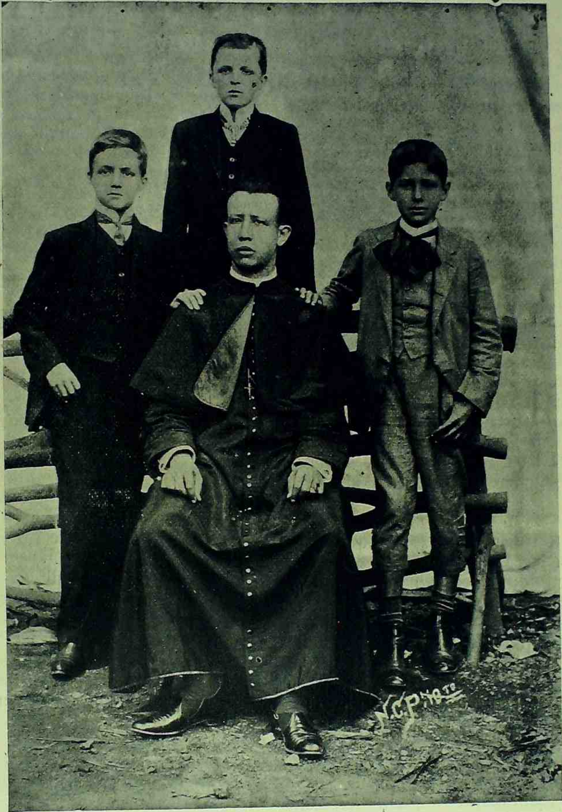
Sta. Anna da Ponte Nova (Minas). Primeiros alumnos do Gymnasio

Estabelecido num dos mais confortaveis predios desta cidade tem por fim proporcionar á mocidade a instrucção secundaria e fundamental necessaria e sufficiente, assim para a matricula nos cursos superiores da Republica, como em geral para o bom desempenho dos deveres do cidadão na vida social e religiosa.