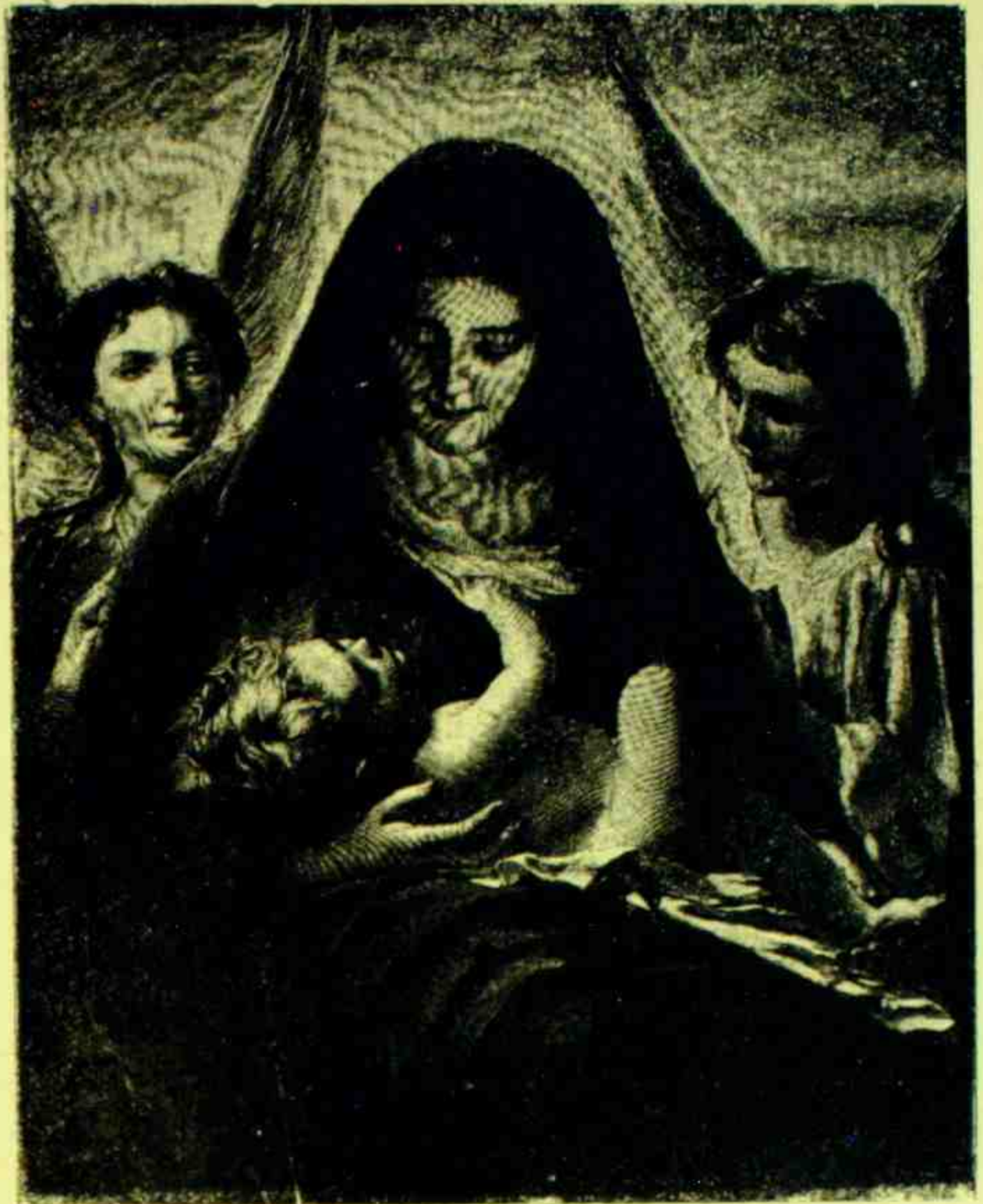
—! A VIRGEM SANTISSIMA E O MENINO JESUS !—