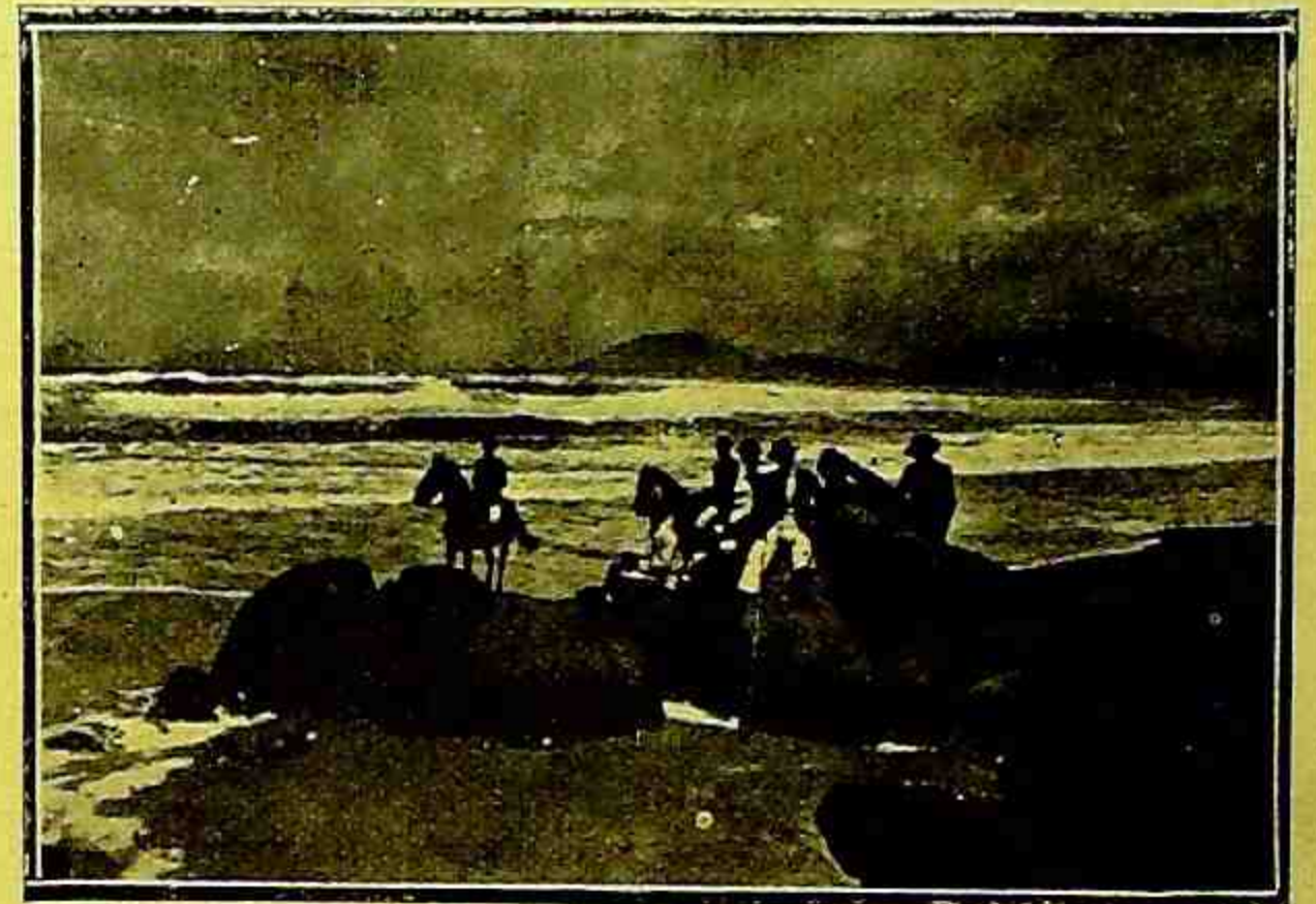
FLORIANOPOLIS — Barra da Lagôa