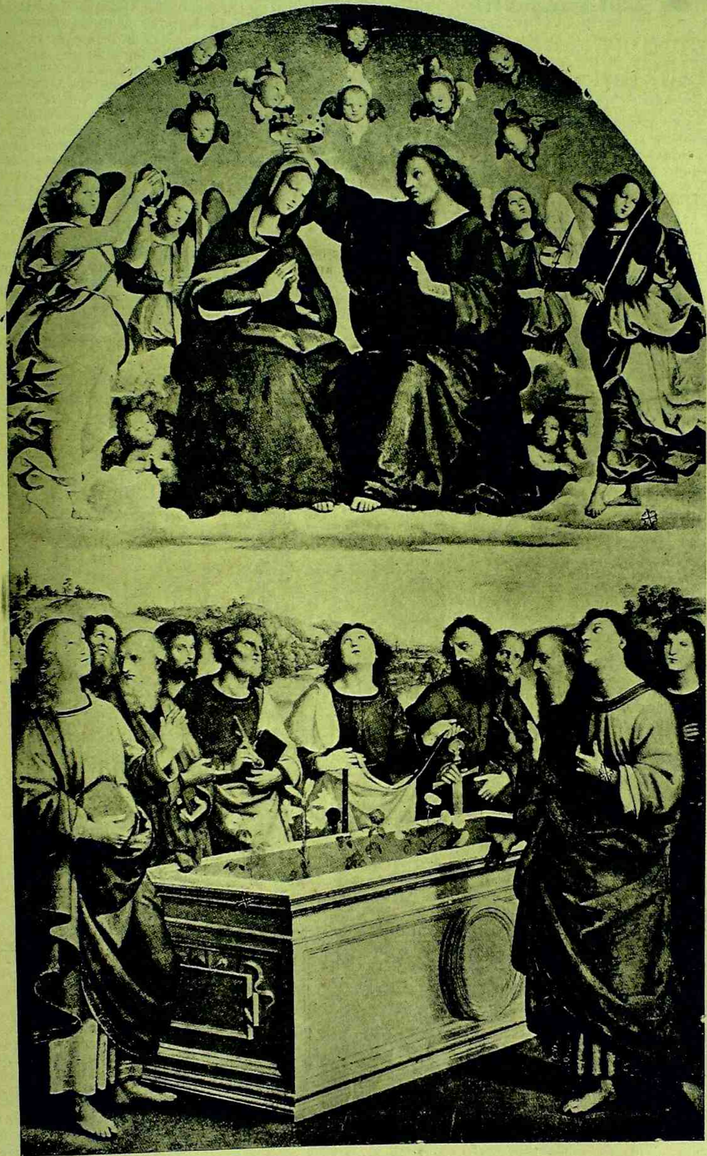
Coroação de Nossa Senhora no Céu. Em baixo os doze Apóstolos.