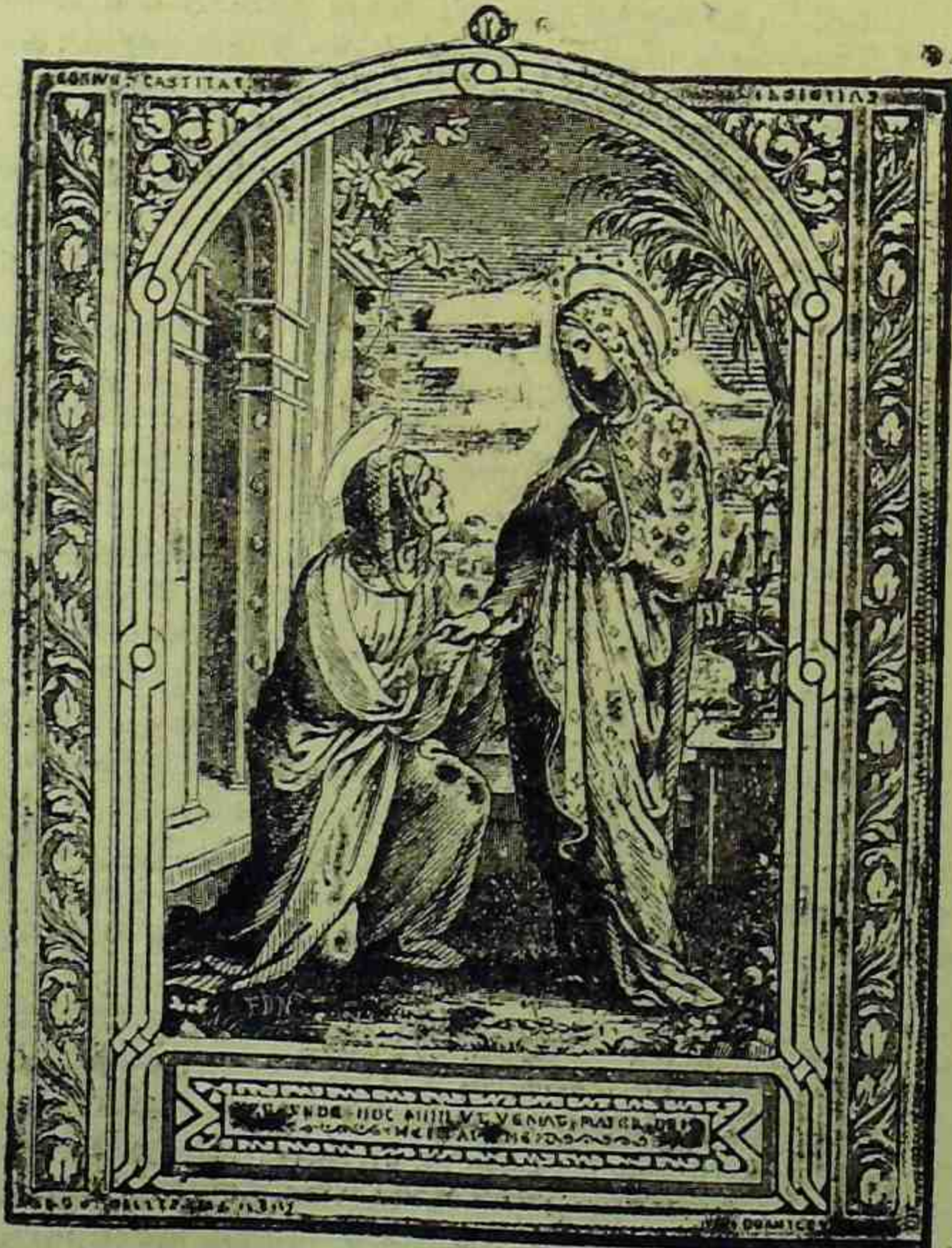
SANT'ANNA, MÃE DE NOSSA SENHORA

Redimindo-a; e de instrumento vil d'expição Que eras, converter-te em symbolo de Perdão, De Justiça, de Amor, de Paz e de Bondade!