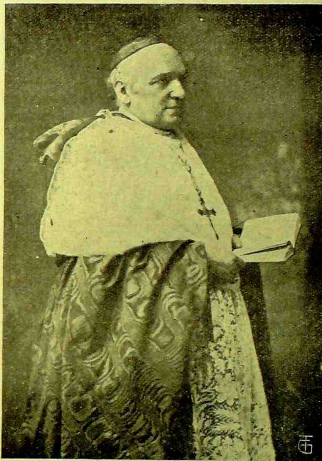
Emmo. sr. Domingos Ferrata, Cardeal Secretario de S. S. Bento XV.

—Rejubila-se um cronista do Correio porque no espaço de 40 annos a Ingleza melhorou notavelmente sua estrada para Santos, chegando a facilitar a ida e volta daquella cidade por meio de sete trens. Com os lucros fabulosos dos inglezes e com os que impediram obter a outras Companhias, não só sete, mas quatorze ou mais trens poderiam-se estabelecer para ida e volta.