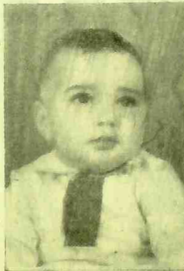
VERA — CRUZ PAULISTA