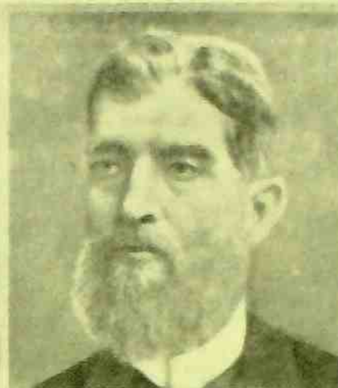
PRUDENTE DE MORAES