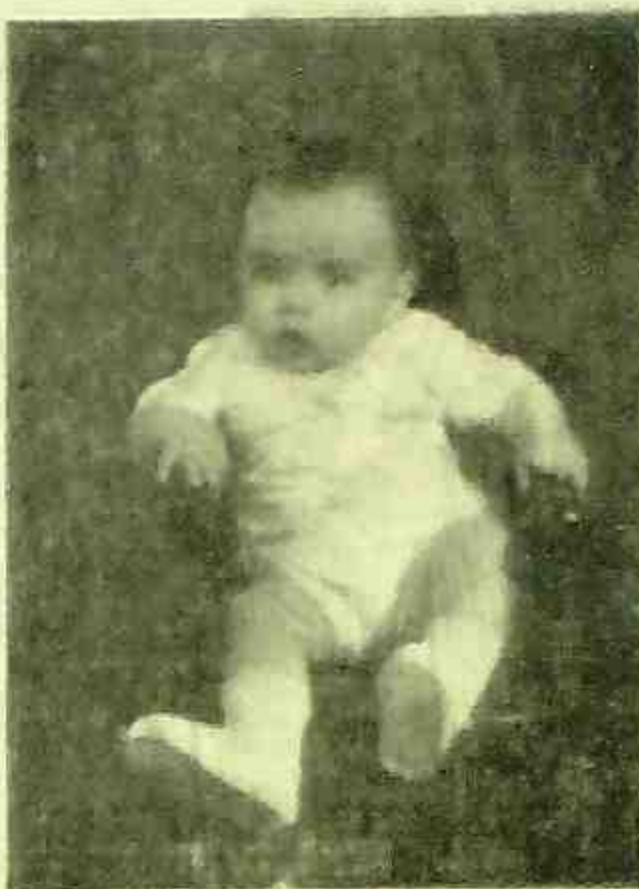
OURO PRETO (Saramenha)