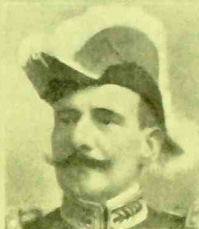
HERMES DA FONSECA