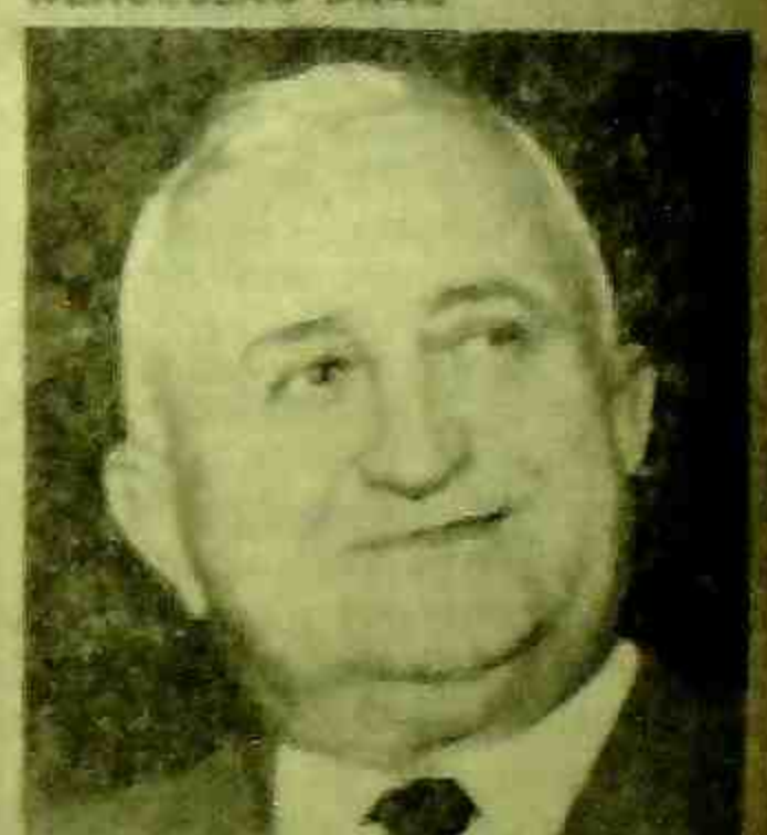
EURICO GASPARI DUTRA