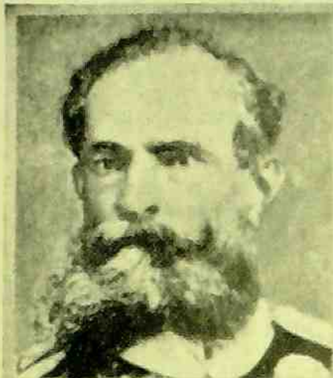
DEODORO DA FONSECA