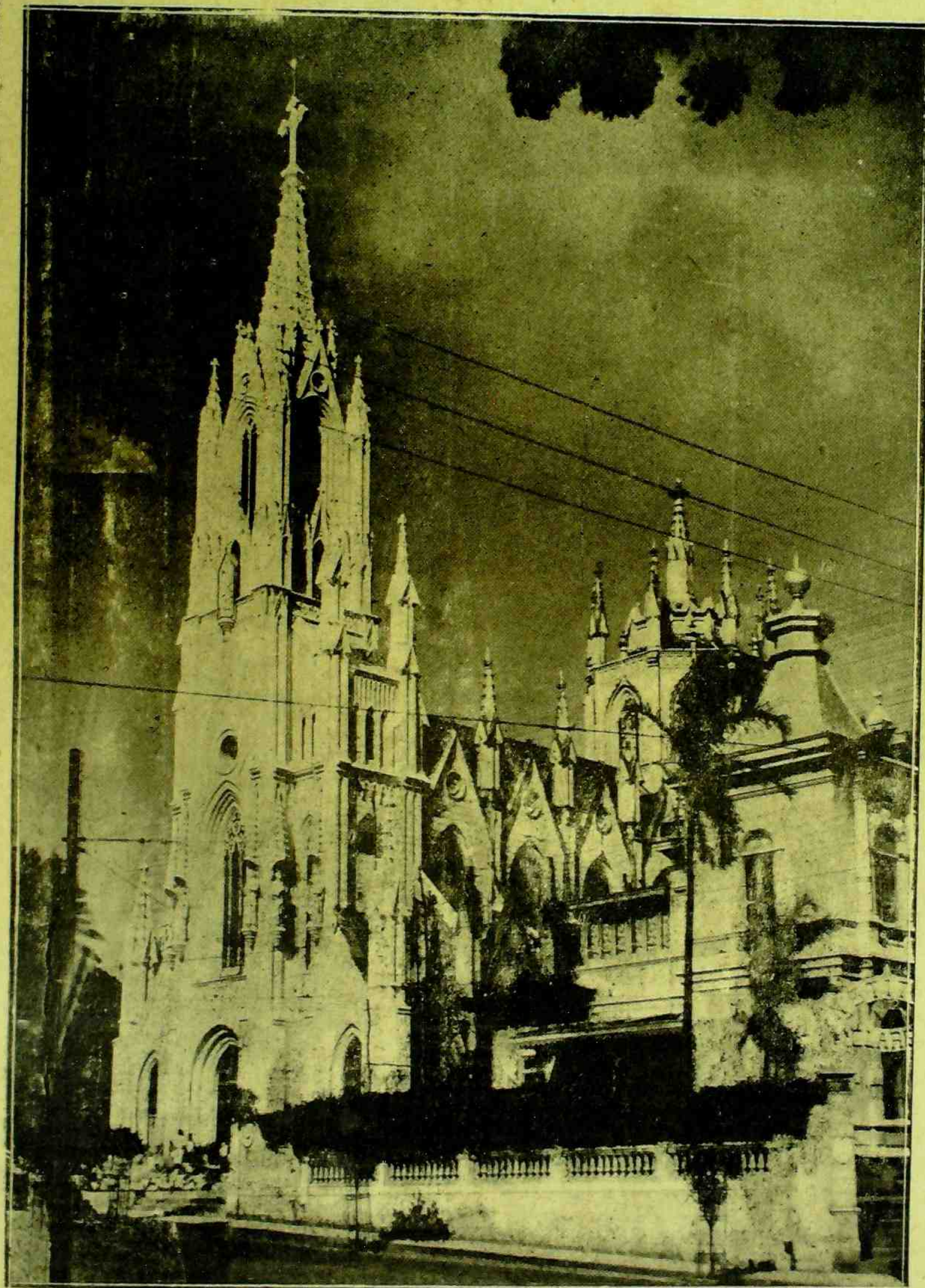
SANTUARIO DE NOSSA SENHORA DE LOURDES EM BELLO HORIZONTE com sua esbelta fachada cujos sinos serão solennemente inaugurados no dia 27.