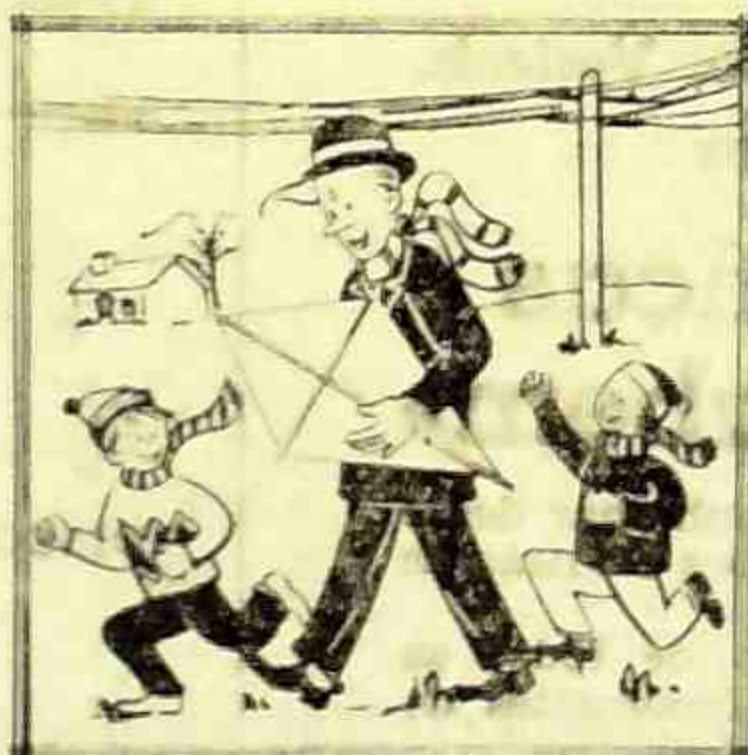
oito traços diferentes num dos quadrinhos latentes. Desdobre suas argúcias e descubra esta minúcia.