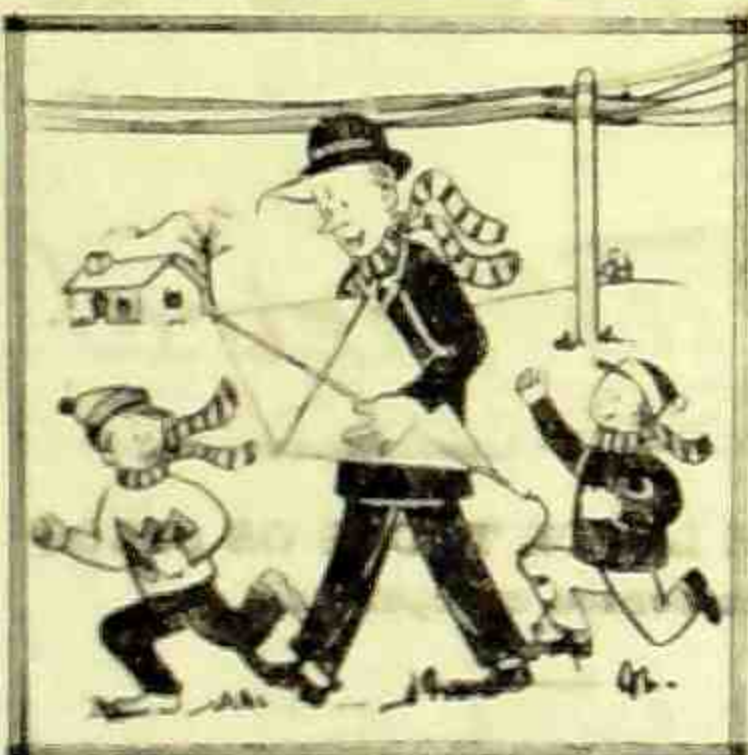
Quadrinhos tão parecidos, que parecem repetidos. Mas o leitor avisado depressa terá notado

ARGENTINA — CRF — Na carta dirigida aos participantes da VII Semana Social em Rosário, Argentina, declara Sua Santidade. "Verifica-se em muitas nações a fuga do homem do campo. É indispensável maior consideração para com o agricultor, fazendo-se com que obtenham uma renda que lhes permita nível de vida proporcional aos que se dedicam à indústria, adotando uma política econômica, favorecendo a agricultura nos impostos, na previdência social, nos preços dos produtos, na formação técnico-profissional".