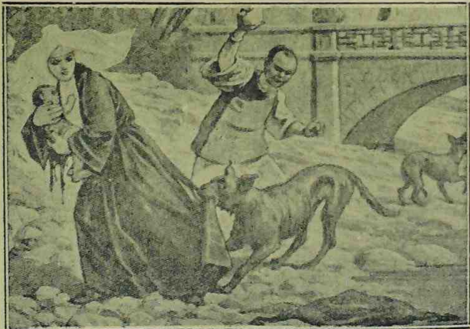
Quantas pobres creanças da China foram e ainda são soccorridas pela caridade maternal da Irmã Missionaria!

Mas os olhos da pequenita santa illuminaram-se duma luz irradiante, mysteriosa: ella via para além, para muito longe, quem sabe? Ao sol dos tropicos, nas florestas da Indo-Chi-