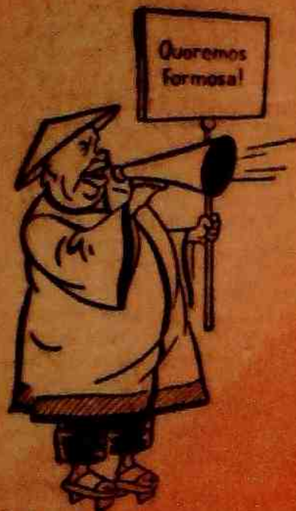
"A União Soviética..."