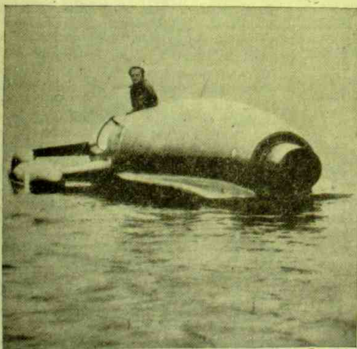
Velocidade-recorde sobre o espelho das águas — Em seu "pássaro azul", o inglês Donald Campbell atingiu o limite máximo, até o momento, de velocidade sobre a água, chegando a percorrer 363 kms. por hora. Durante a corrida chegou a fazer até 460 kms. por hora.

Efetou o Santo Padre demorada visita às principais secções da Biblioteca Vaticana, onde todos os funcionários lhe prestaram respeitosa homenagem. Sua Santidade admirou particularmente os moderníssimos fichários, o laboratório fotográfico e a sala das micro-leituras e micro-fichários, lugares em que a mais moderna técnica serve à Ciência e à Fé.