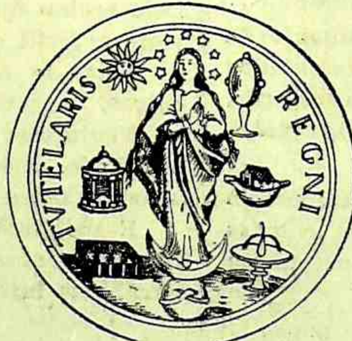
Tela a óleo de 1646, durante o reinado de D. João IV, rei de Portugal, proclamando N. Senhora da Conceição Patrona do Reino.

★ OS SANTOS obrigam, por assim dizer, Deus a escutar-nos; fazem, quando os invocamos, como os guerreiros perante os potentados terrestres: mostram as feridas recebidas nas batalhas e Deus nada lhes pode recusar!