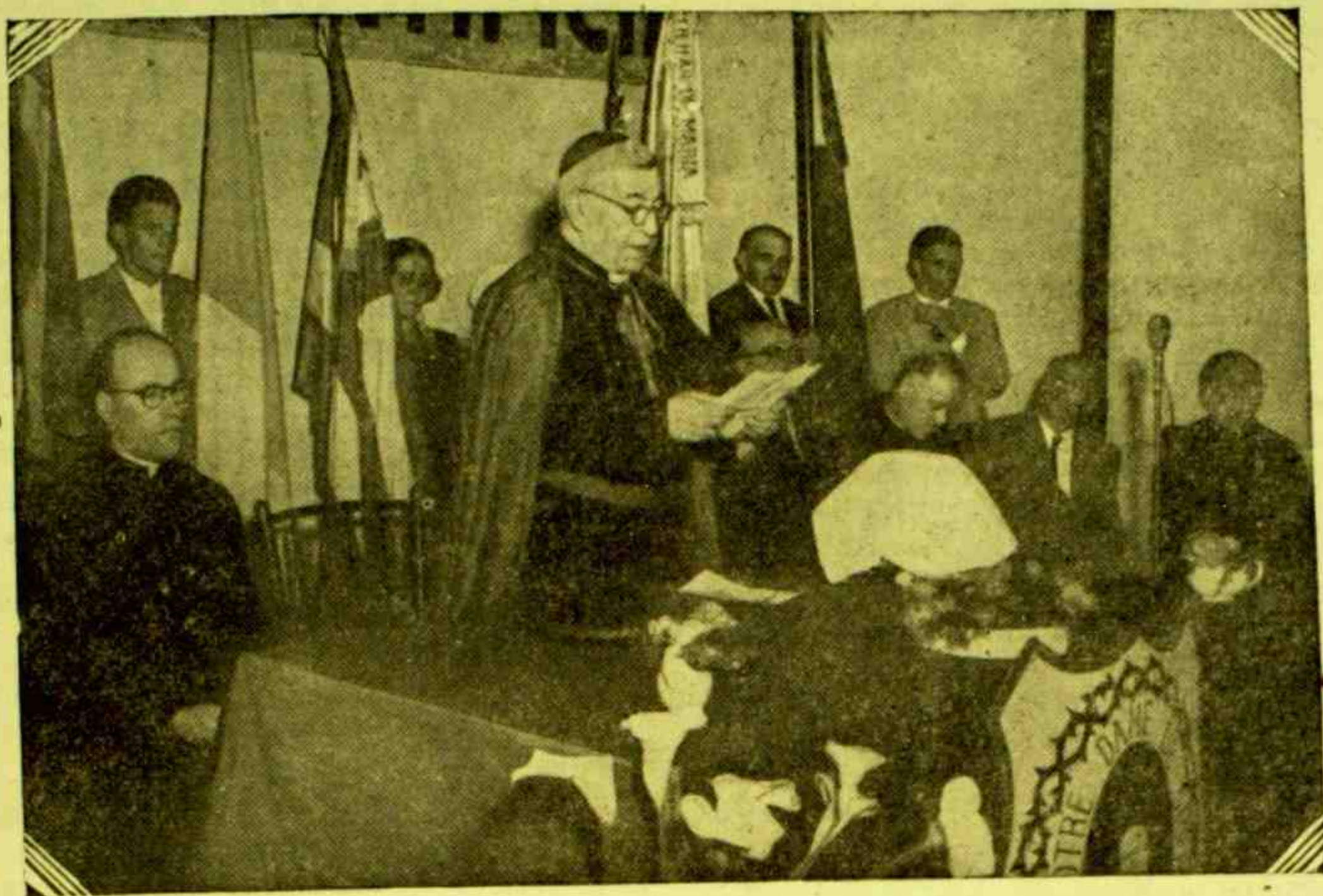
SÃO PAULO — O Exmo. Sr. Núncio Apostólico pronuncia importante discurso antes da entrega da bandeira pontifícia à paróquia de São José do Ipiranga.