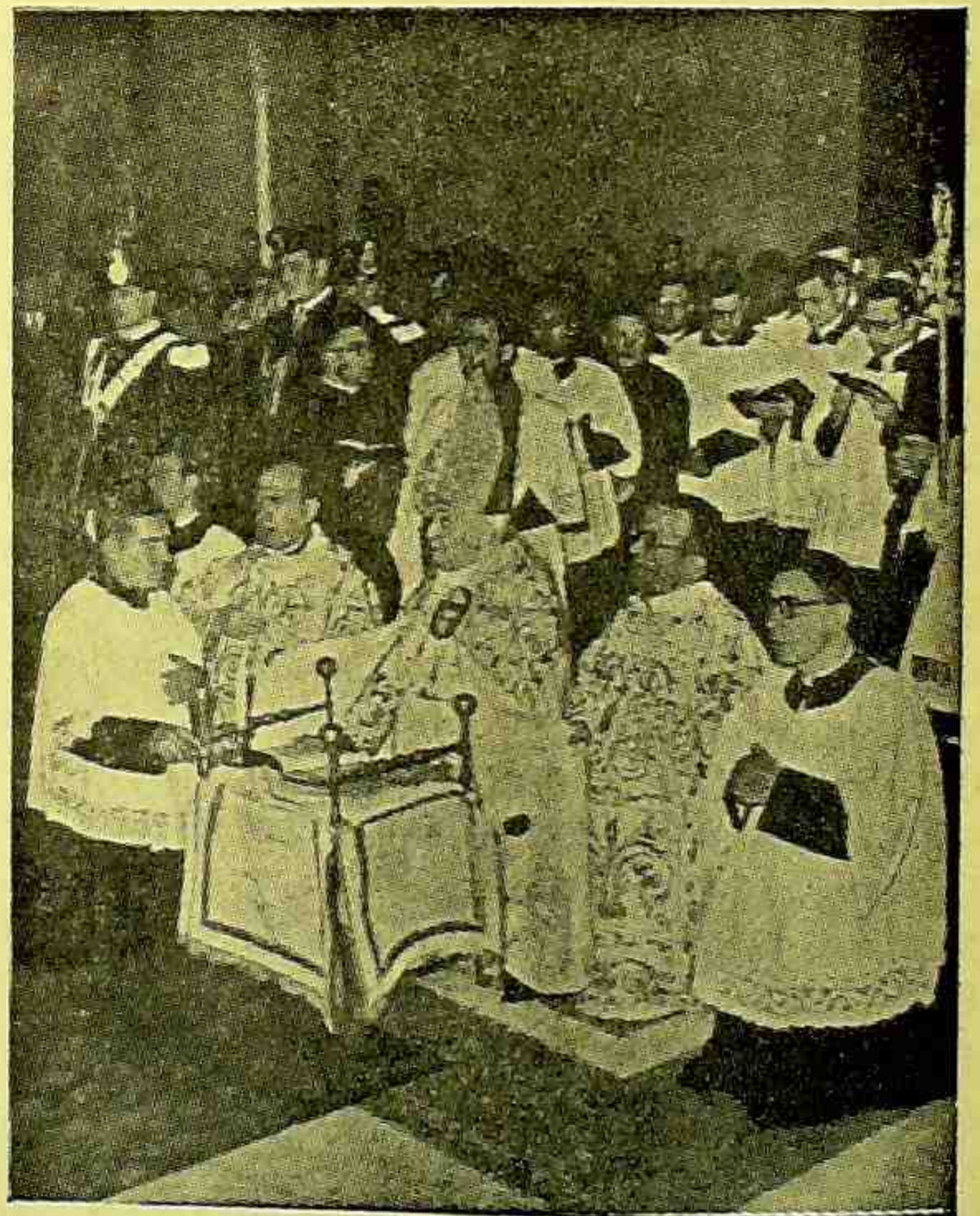
ROMA — O Emmo. Cardeal Clemente Micara na inauguração do Templo Votivo ao Imaculado Coração de Maria.

A 12 de Abril próximo, quinhentos carteiros da capital, acompanhados de suas famílias, visitarão, em romaria, a Basílica Nacional de Nossa Senhora Aparecida. O principal objetivo dessa visita àquele tradicional santuário mariano, é render filial homenagem à excelsa Padroeira do Brasil e trazer um "fac-simile" da veneranda imagem, que a 14 de Maio do corrente ano, em imponente solenidade religiosa, será oferecida pelos carteiros de São Paulo ao povo católico de Jundiaí, neste Estado.