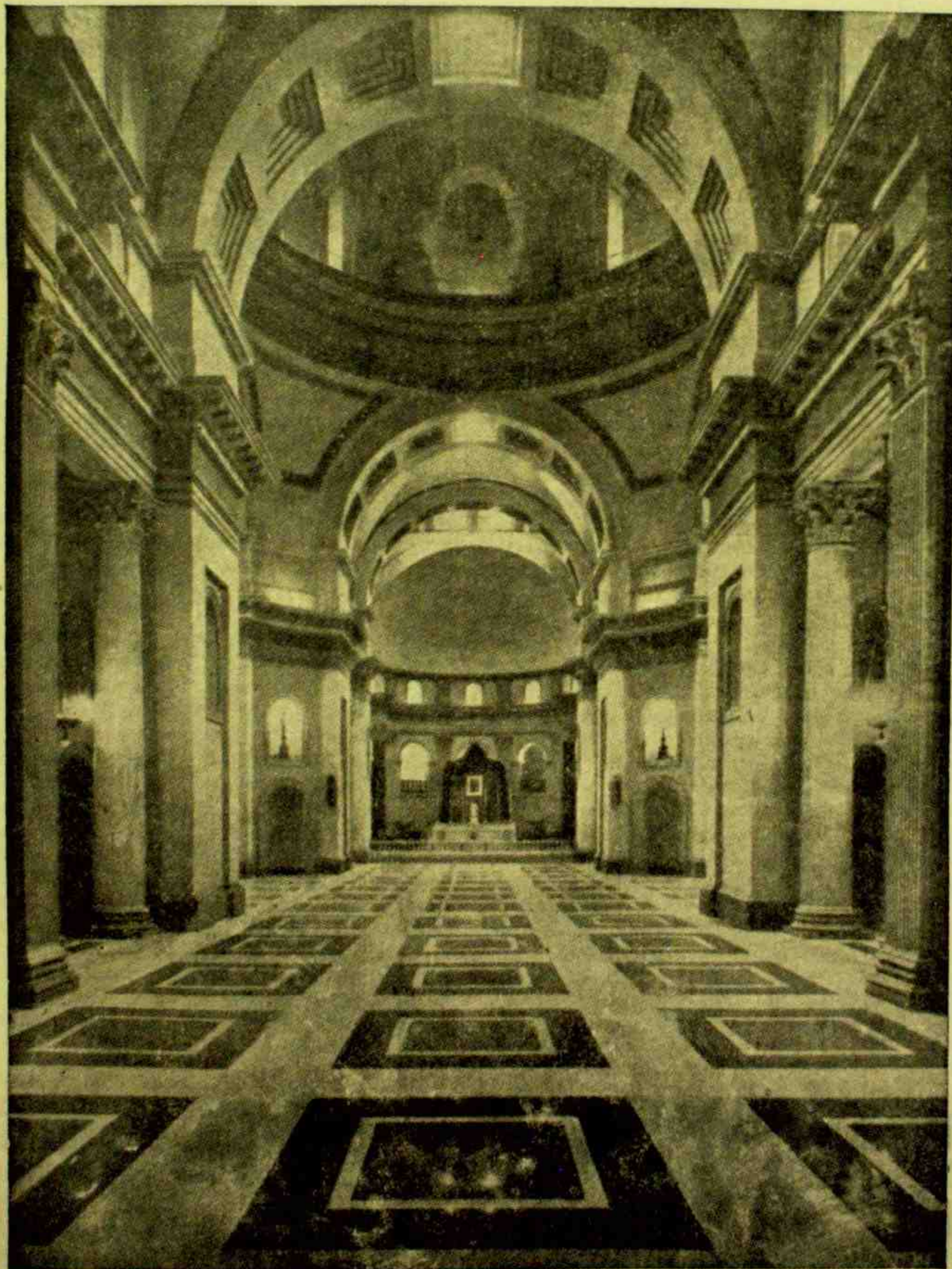
ROMA — Nave central do Templo Votivo da Paz ao I. Coração de Maria. Foi inaugurado recentemente. Tem 81 metros de comprimento e 57 de largura. O diâmetro interno da cúpula é de 21 metros.