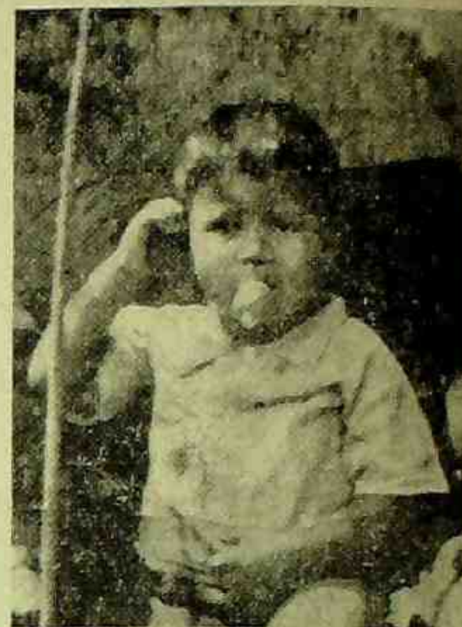
CAMPOS GERAIS Antônio Maria Claret