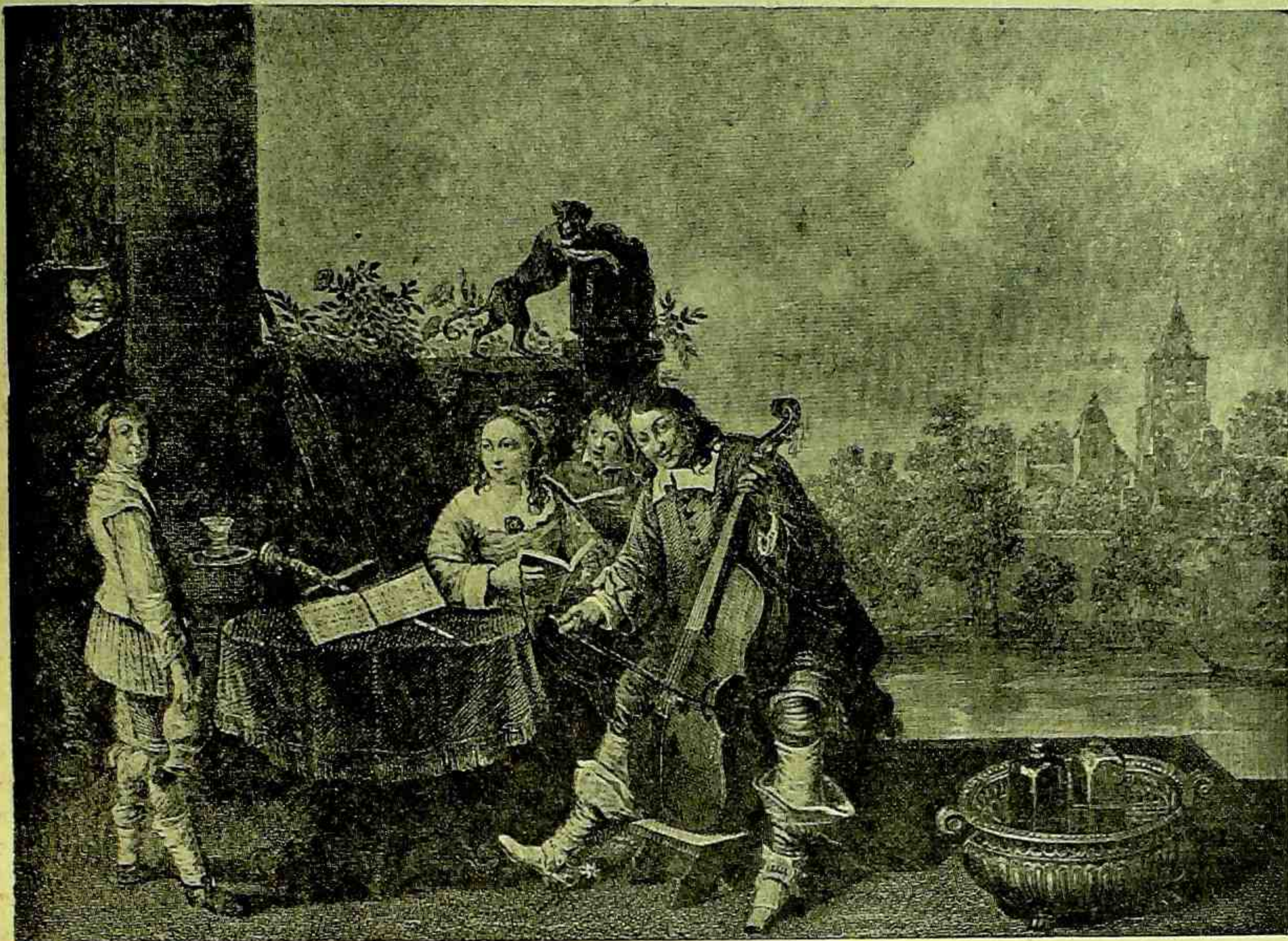
Todos músicos, gozando das alegrias do lar.