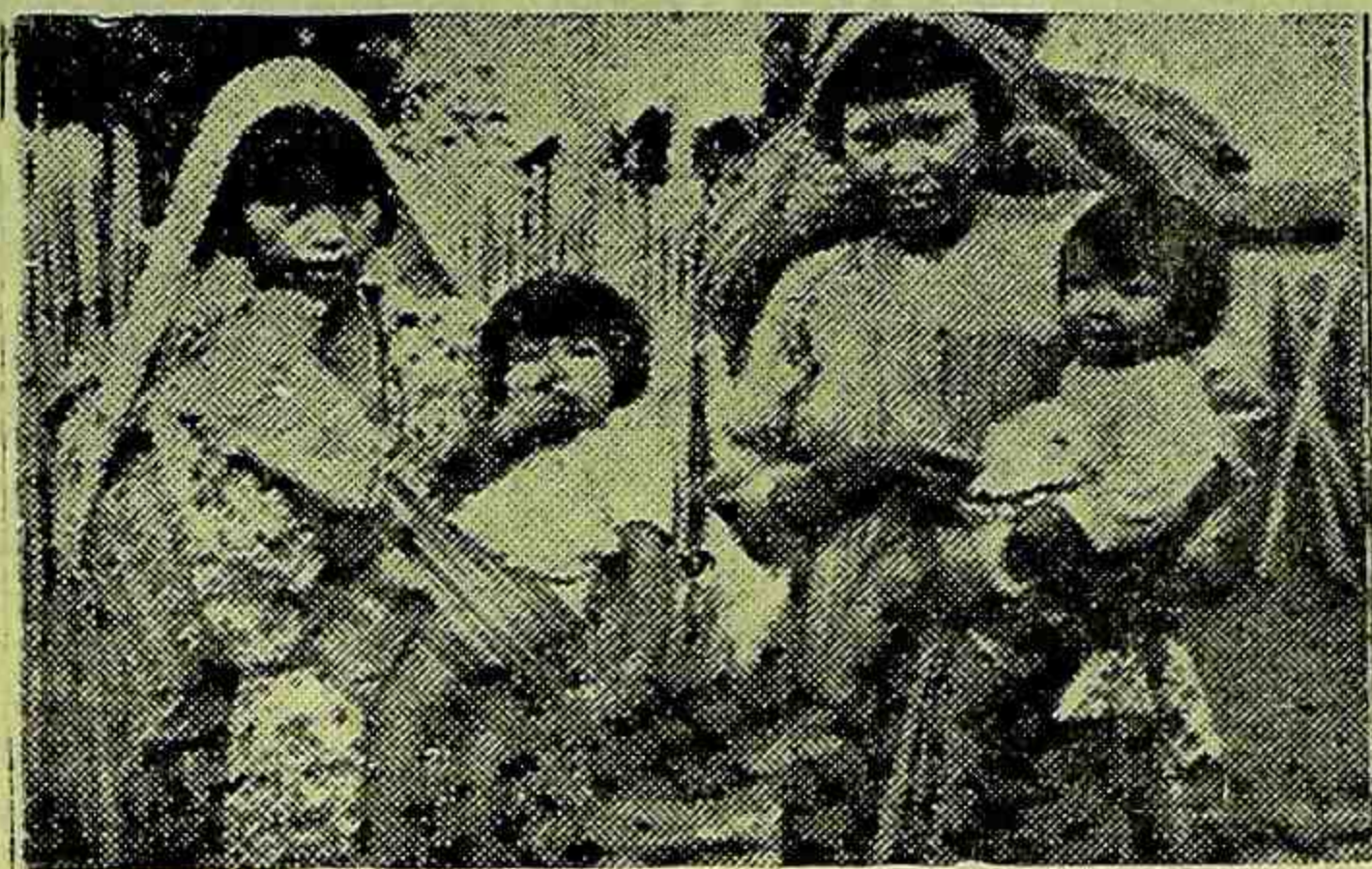
MATO GROSSO — Índios civilizados pela dedicação dos Padres Salesianos.