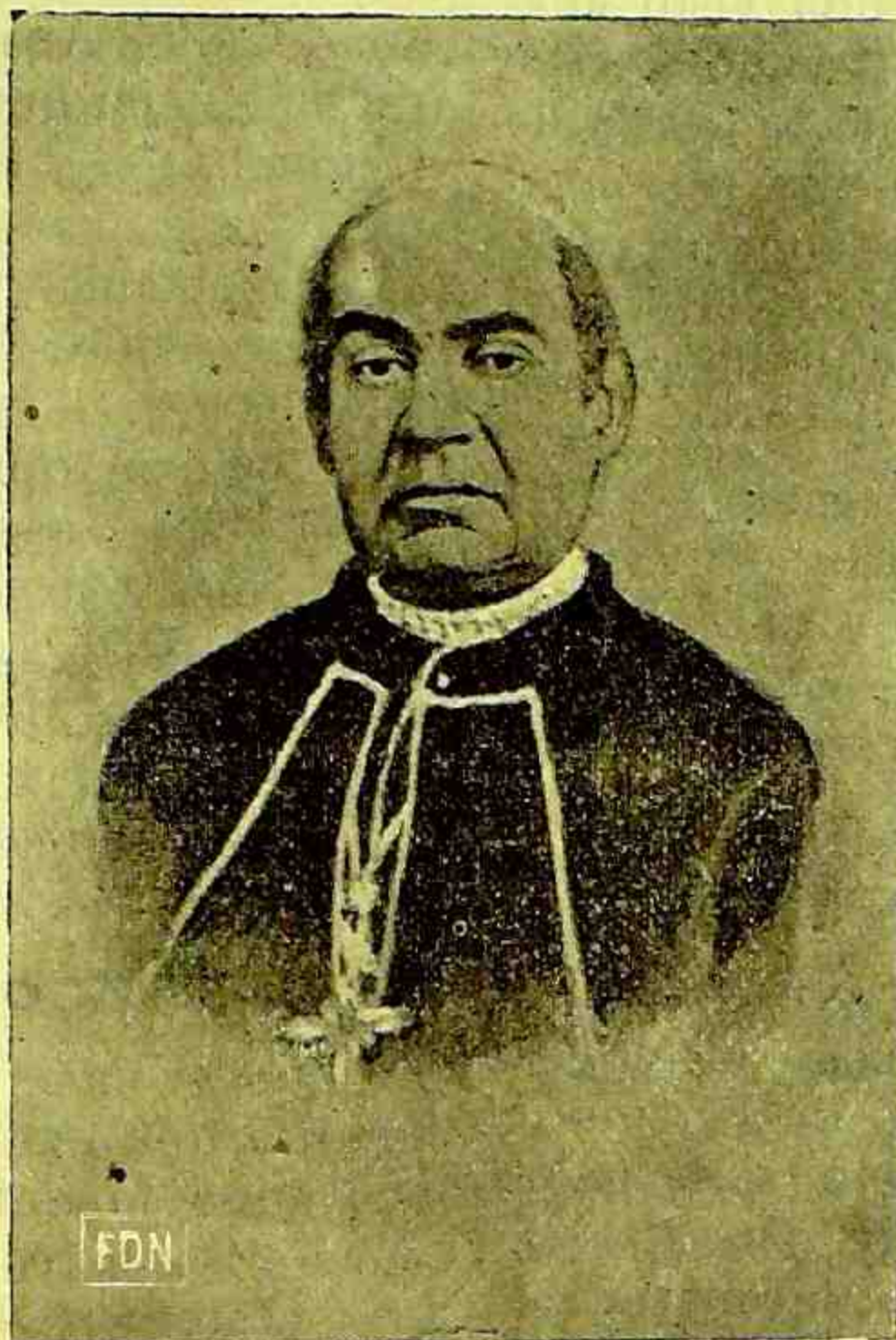
Ultimo retrato do Veneravel P. Antonio M. Claret.