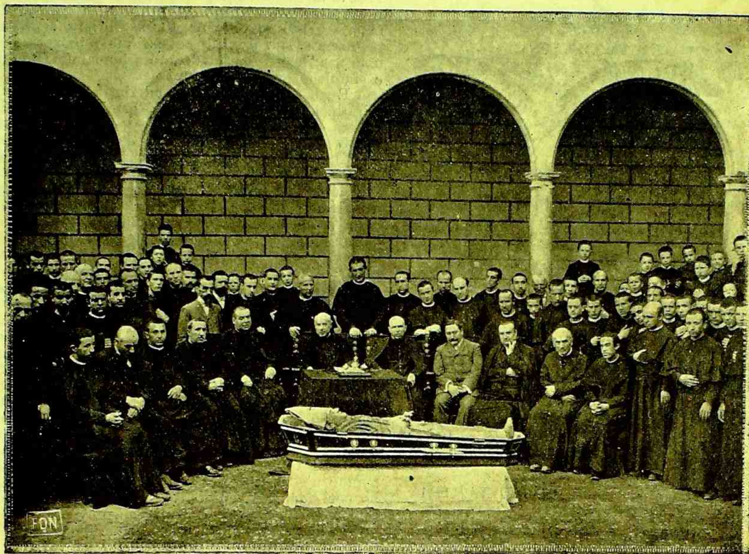
O Tribunal Ecclesiastico e a Communidade de Missionarios de Vich perante os restos do Venerabel Padre Claret

todos os dias que houve de estar o santo corpo ao ar livre, não se observasse fedor algum.