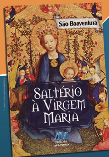
16x13 cm - 168 págs.

Este livro traz uma coleção de salmos escritos especialmente em louvor à Santíssima Virgem Mãe de Jesus e nossa. Através das palavras de São Boaventura, teólogo e Doutor da Igreja, cada um dos 150 salmos dessa obra, levam o leitor a ter um profundo amor e confiança em Nossa Senhora, e com ela, caminhar ao encontro com o Senhor.