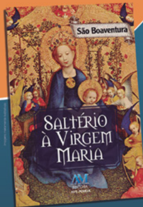
9x13 cm - 168 pages

Este livro traz uma coleção de salmos escritos especialmente em louvor à Santíssima Virgem Mãe de Jesus e nossa. Através das palavras de São Boaventura, teólogo e Doutor da Igreja, cada um dos 150 salmos dessa obra, levam o leitor a ter um profundo amor e confiança em Nossa Senhora, e com ela, caminhar ao encontro com o Senhor.