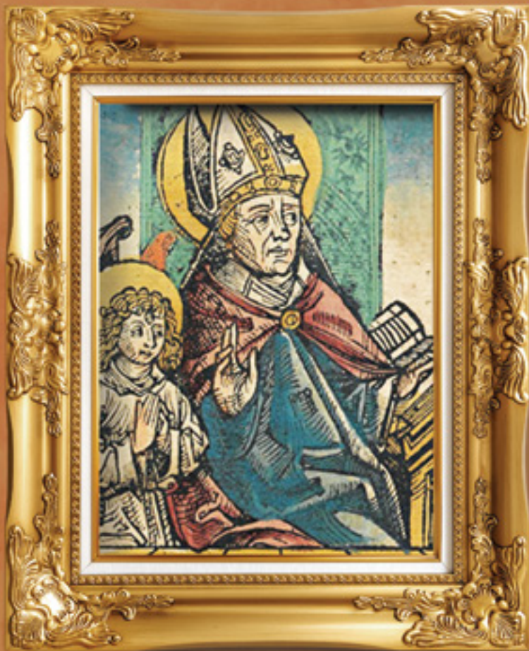
Imagem: Ilustração de Nuremberg Chronicle