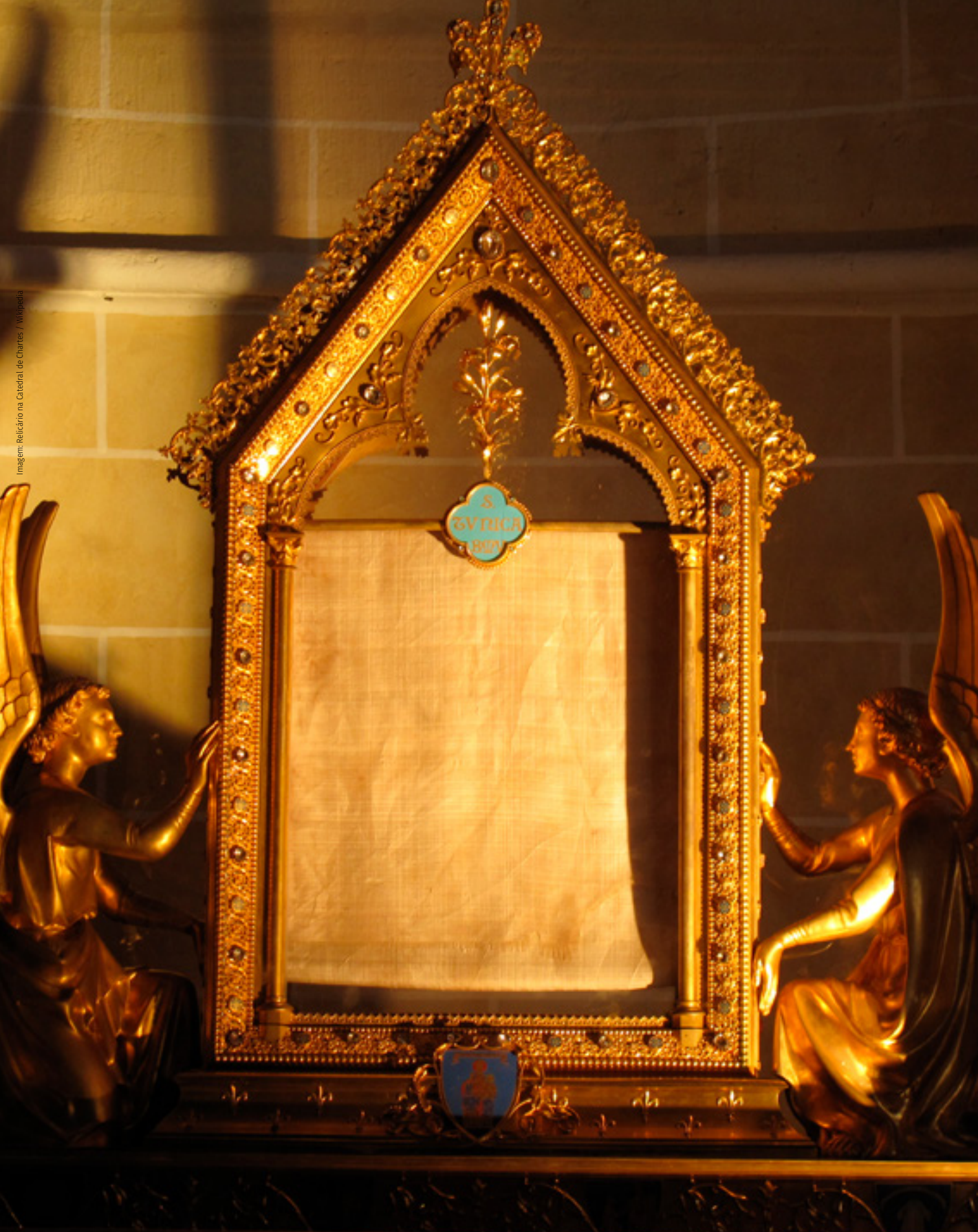
Imagem: Relicário na Catedral de Chartres