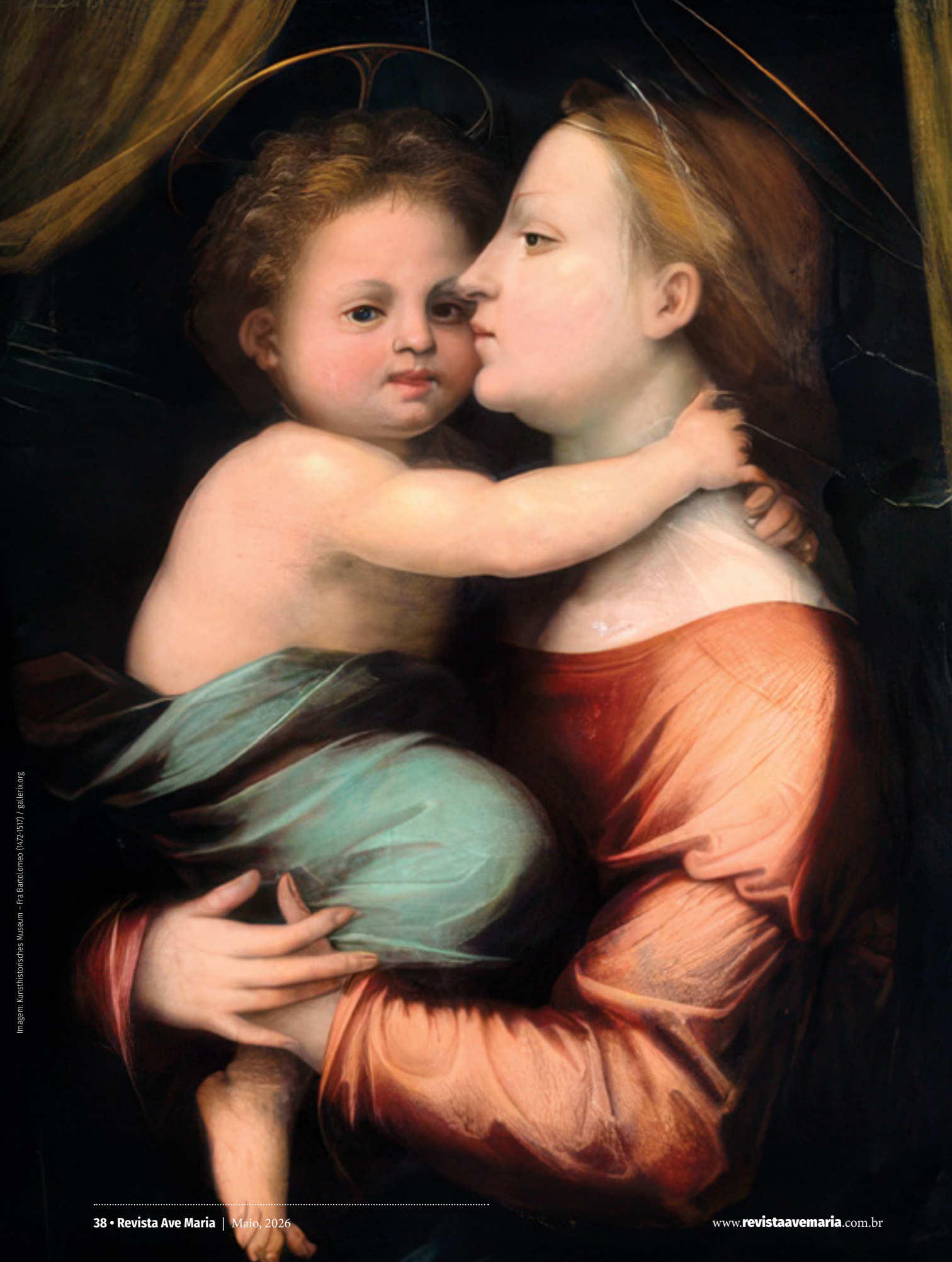
Fra Bartolomeo (1472-1517)