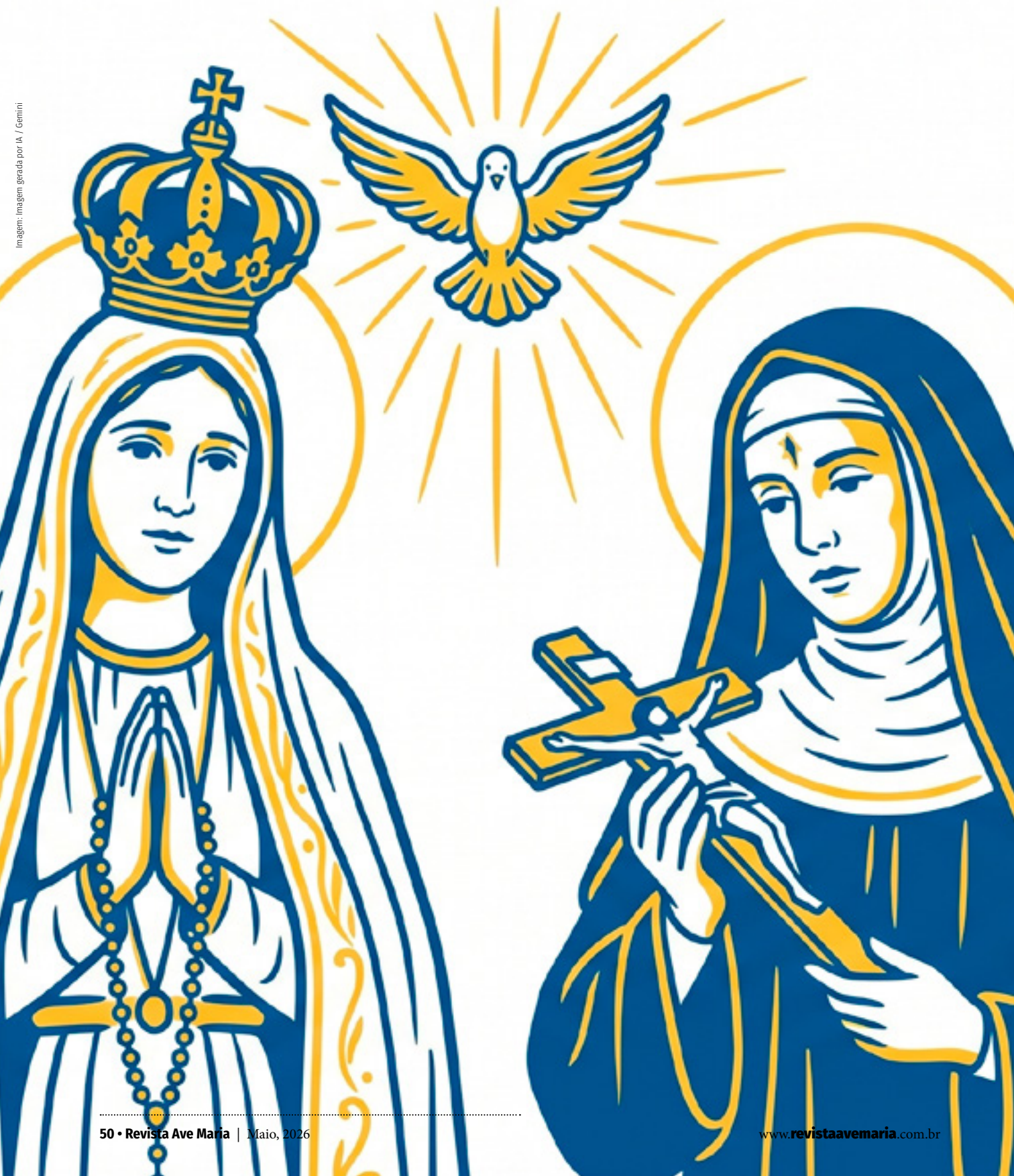
Imagem: Imagem gerada por IA / Gemini