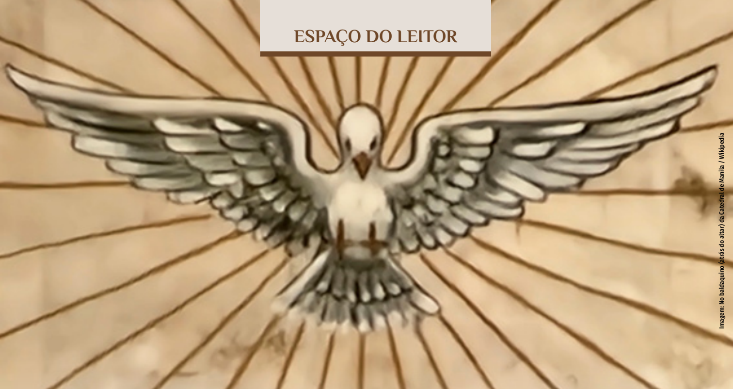
Imagem: No balaquino (atrás do altar) da Catedral de Manila