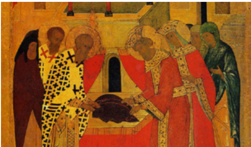
Imagem: Deposição do Manto da Virgem em um ícone de 1485

*Padre Reinaldo Bento é sacerdote incardinado na Diocese de Osasco (SP).