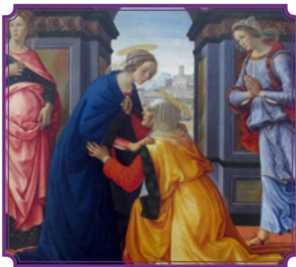
Imagem: A obra Visitação, de Domenico Ghirlandaio (1491)

Assim, mais do que um cântico de resignação, o Magnificat é uma verdadeira força libertadora e,