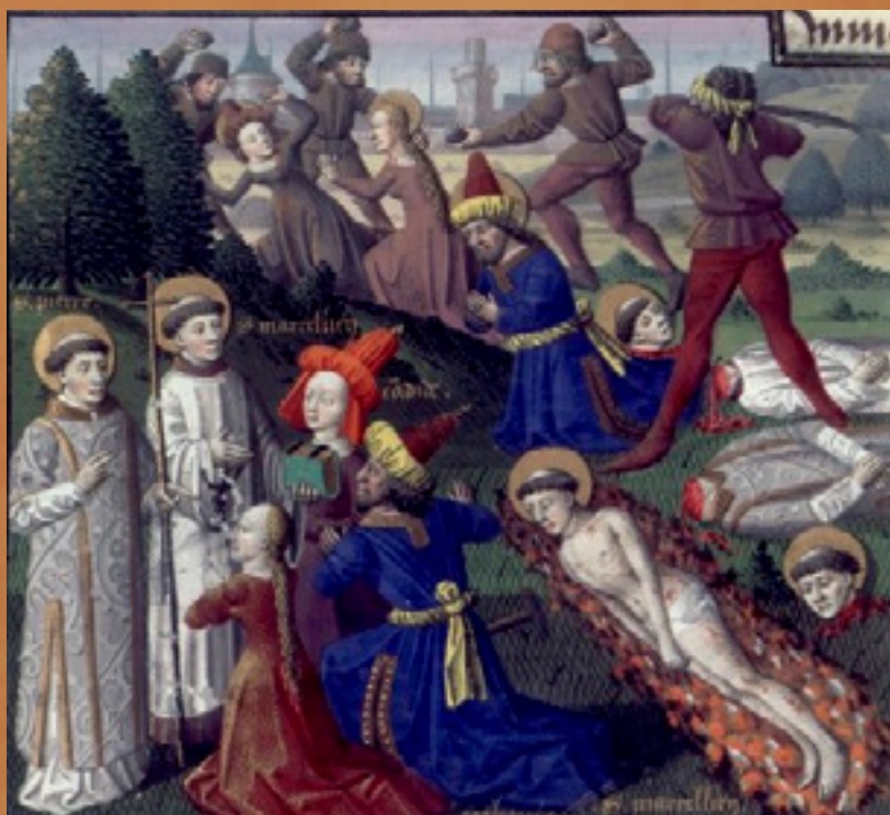
Imagem: Artemius, Cândida e Paulina diante dos santos Marcelino e Pedro, ilustração do Speculum Maius (século XV)

O relato, enriquecido com tantas particularidades, queria confirmar a irresistível difusão do cristianismo no mundo greco-romano. ●